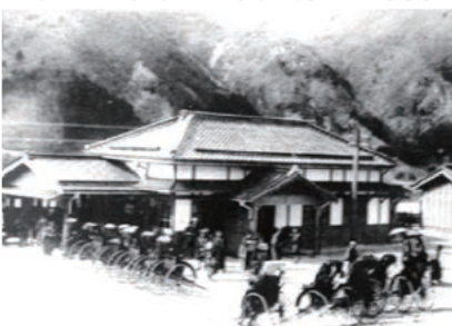
↑大正時代の鳴子駅